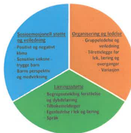
Fig 1. Tils tre hovedelementer

Målet med CLASS er å stimulere til gode interaksjoner og samspill mellom barn og voksne slik at barna opplever trygghet, livsmestring, og støtte til utvikling og læring i sin hverdag. Et godt leke- og læringsmiljø utvikles der samspillet mellom voksne og barna er preget av positive, støttende, trygge omgivelser, i strukturerte og forutsigbare rammer. Metoden er motiverende og utviklende, og bidrar til å øke kunnskap om hva som kan gjøres for å øke kvaliteten i barnehagen.